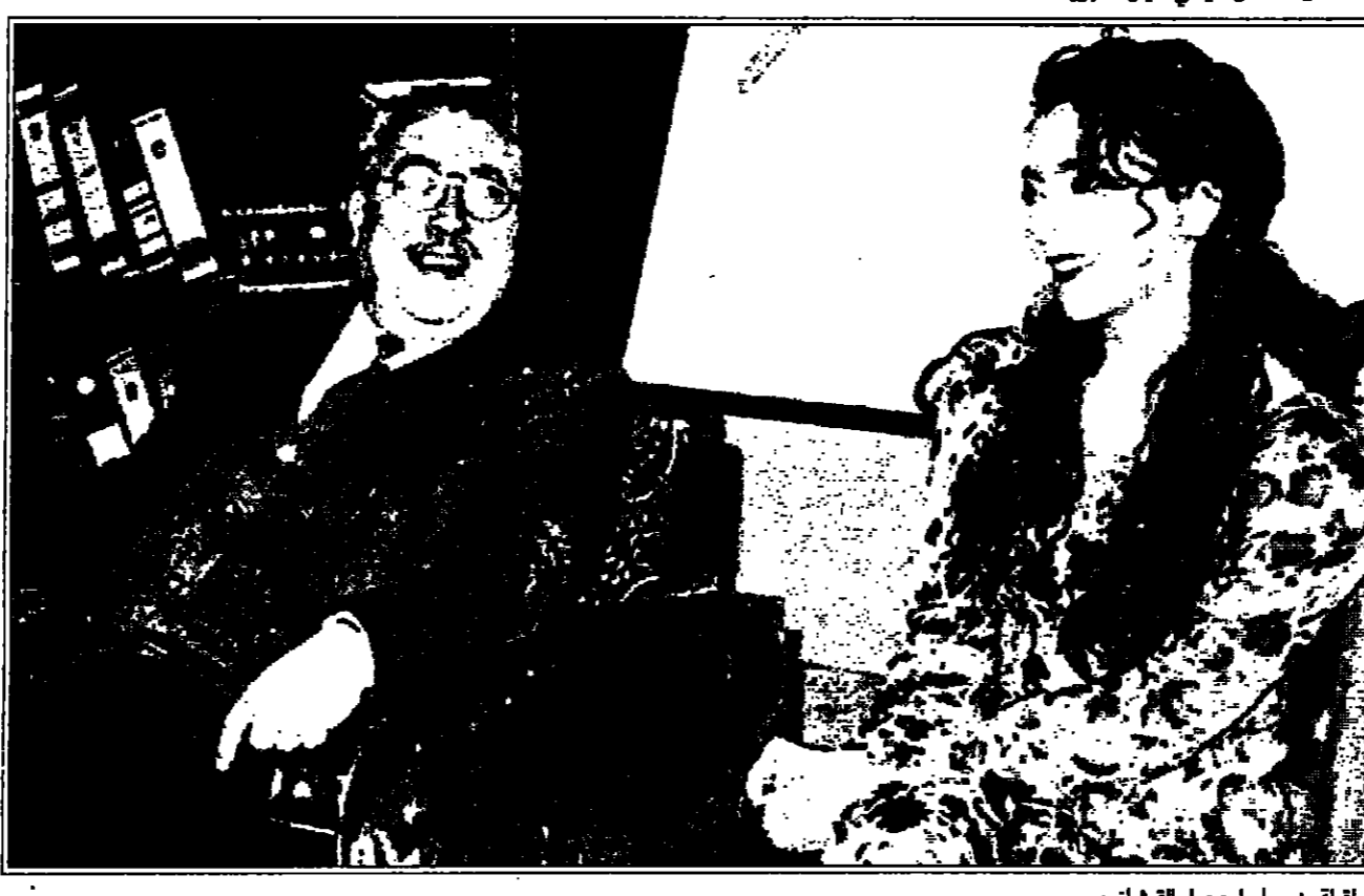
لقطة من مسلسل «عمران»